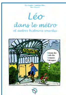
Édition hors commerce pour la RATP