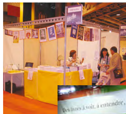
Stand au salon Autonomic, Paris