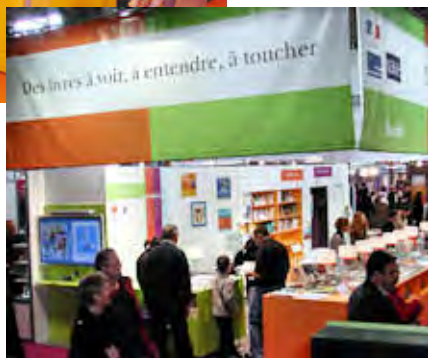
Salon du Livre, sur le stand du ministère de la culture, Lecture adaptée, Paris